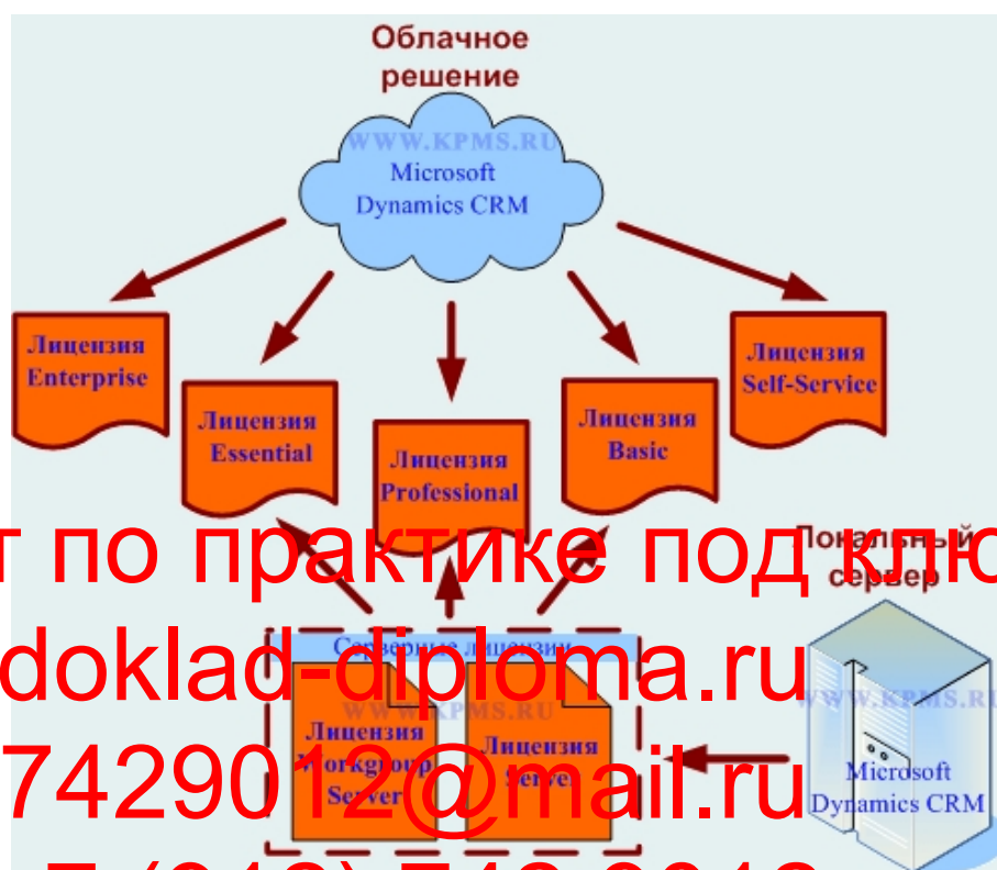
Рисунок 2 – Облачное решение MS Dynamics CRM

- Microsoft Dynamics CRM 2016 Server. Для этой лицензии нет ограничений на количество пользователей системы. Сервер может обслуживать несколько предприятий, входящих в холдинг. Возможна установка нескольких экземпляров сервера и установка сервисов на основе ролей.