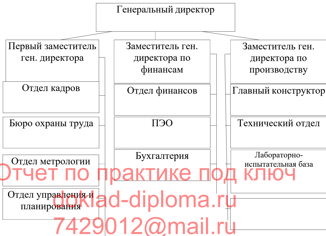
Рисунок 1 - Организационная структура управления АО «Северное производственное объединение «Арктика»

Генеральный директор, обеспечивает выполнение деятельности организации, заключает договора, распоряжается имуществом организации в установленном законом порядке. Так же, директор издает приказы обязательные для работников организации.