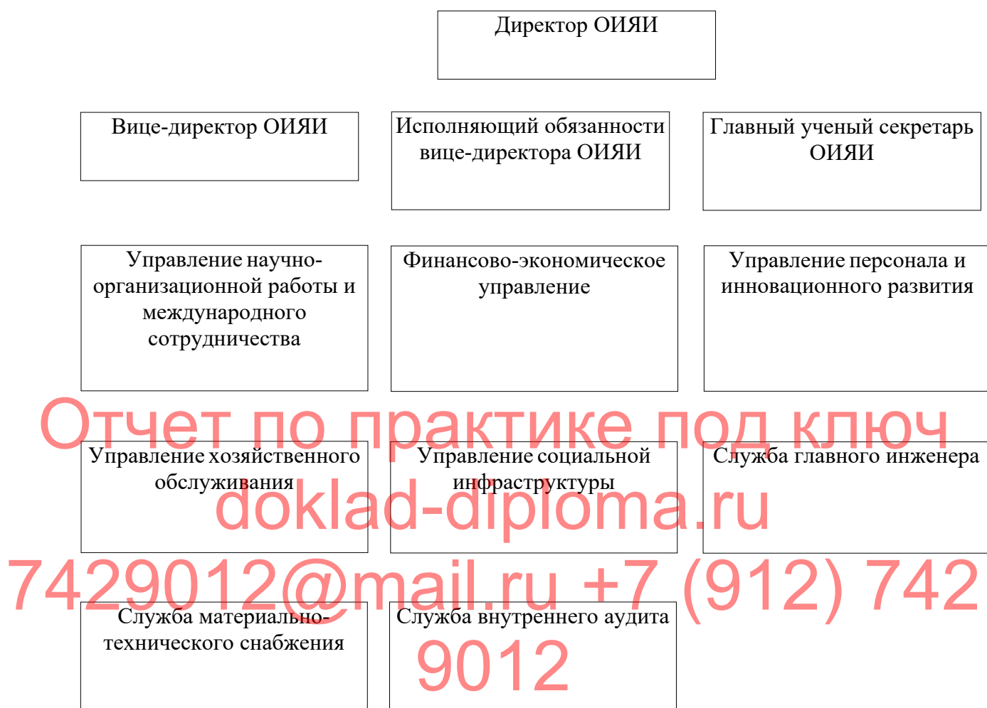
Рисунок 1 - Организационная структура ОИЯИ

Бухгалтерия ОИЯИ выполняет следующие функции в сфере бухгалтерского учета: обеспечивает учет всех операций, обязательств, оплату счетов и платежных ведомостей; составляет периодическую бухгалтерскую отчетность; обеспечивает внутренних и внешних пользователей необходимой бухгалтерской информацией для принятия решений. В сфере хранения денежных средств – обеспечивает необходимые взаимоотношения с банками и другими финансовыми организациями, связанные с поступлением и использованием активов Института.