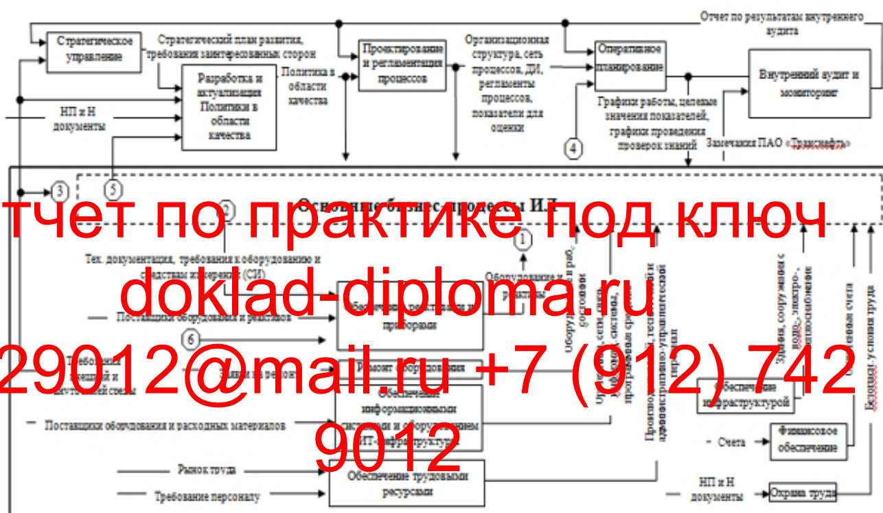
Рисунок 2 – Сеть процессов испытательной лаборатории ОИЯИ

Нами была разработана сеть процессов для Испытательной лаборатории с указанием входов, выходов, основных ресурсов.