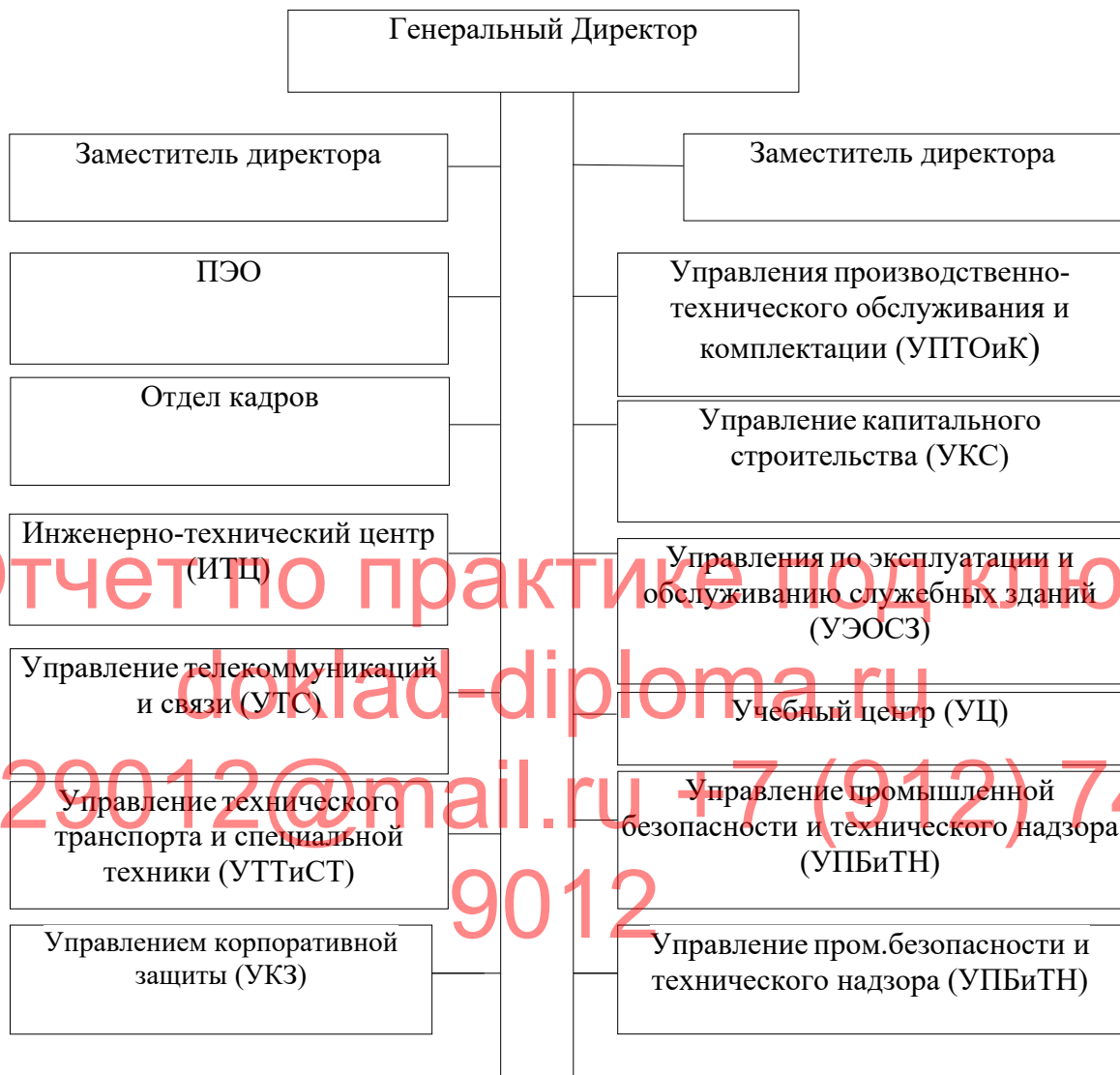
Рисунок 1 - Организационная структура предприятия ООО «Эм-Си Баухеми»

Организационная структура ООО «Эм-Си Баухеми» представлена на рисунке 1.