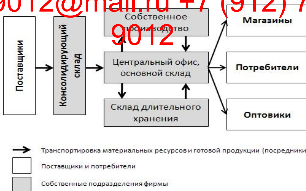
Рисунок 3 - Логистическая сеть ООО «ПК ВентКомплекс»

На рисунке 3 показана логистическая сеть ООО «ПК ВентКомплекс».