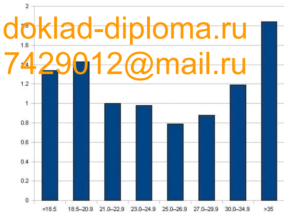
Рисунок 2 – Женская статистика