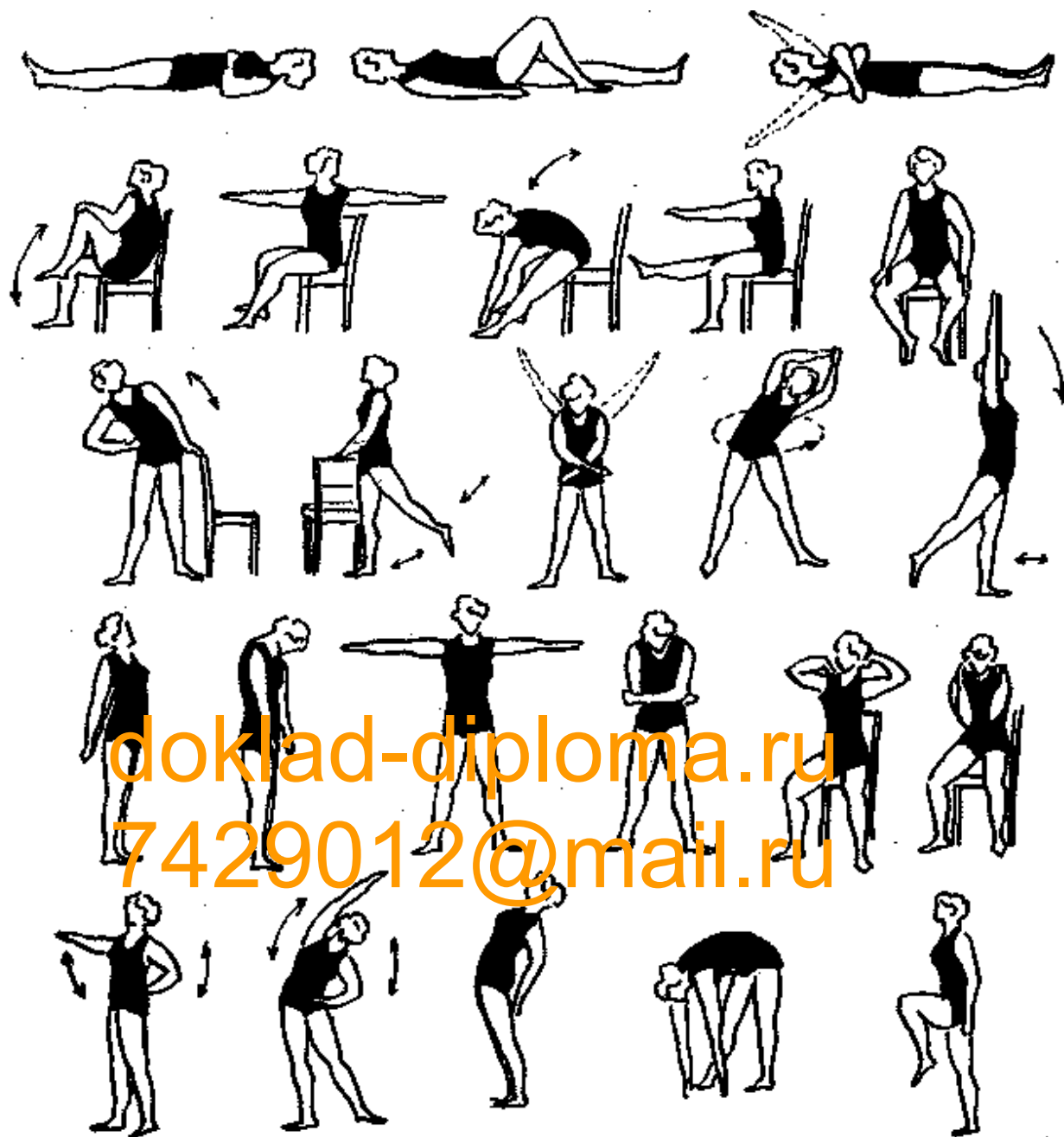
Рисунок 3: Лечебная гимнастика