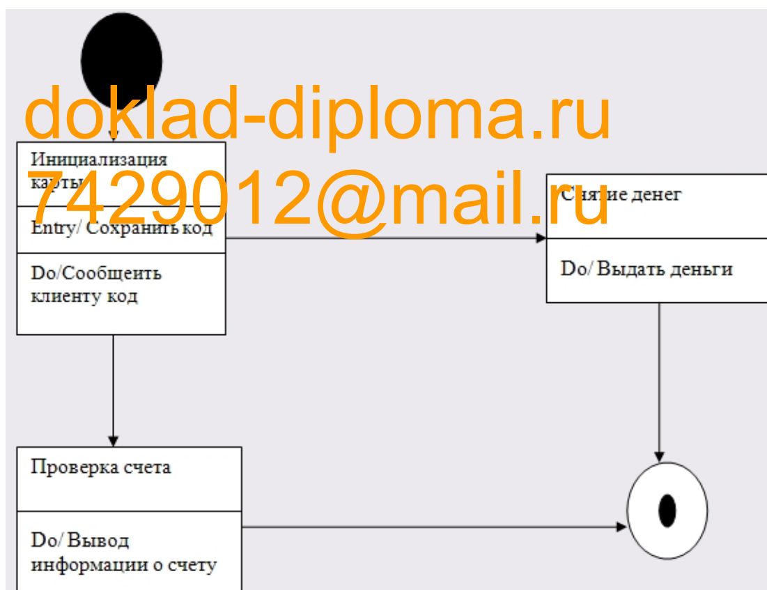
Диаграмма состояний является графом специального вида, который представляет некоторый автомат. Вершинами графа являются возможные состояния автомата, изображаемые соответствующими графическими символами, а дуги обозначают его переходы из состояния в состояние. Диаграммы состояний могут быть вложены друг в друга для более детального представления отдельных элементов модели.

спецификации функциональности других компонентов моделей, таких как варианты использования, актеры, подсистемы, операции и методы.