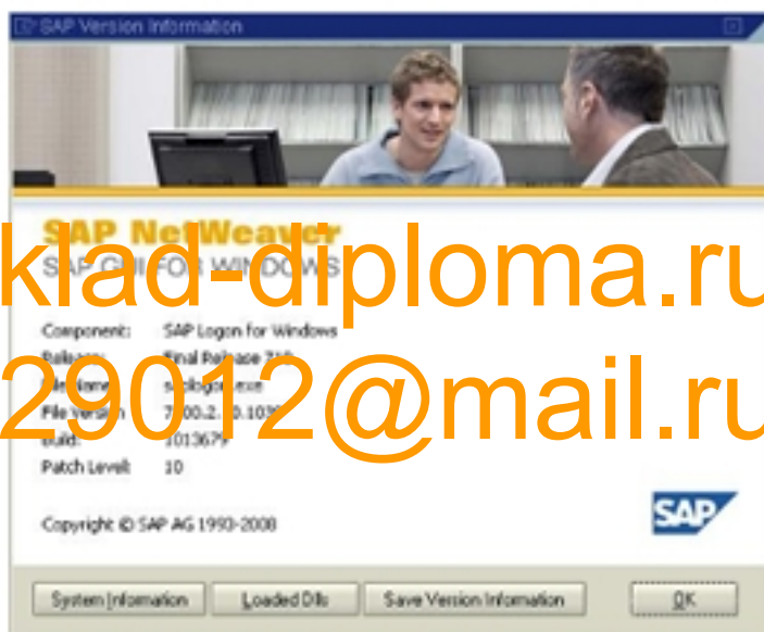
Рисунок 3 - Стартовое окно SAP R/3

Система R/3 представляет собой набор приложений, написанных исключительно на языке АВАР/4 и поэтому не зависящих от конкретной платформы. Язык АВАР/4 занимает центральное место в программном обеспечении связного уровня, что позволяет сделать программу независимой от аппаратуры, операционной системы и СУБД.